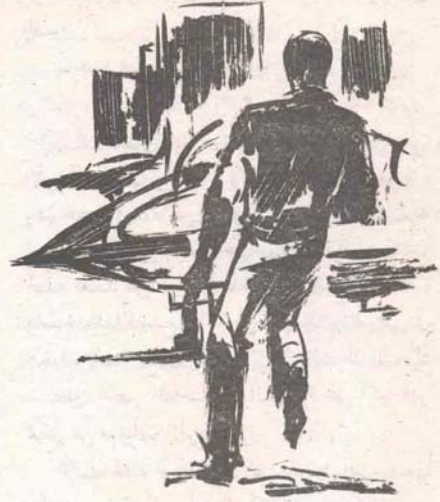
ثم تحرك في حفة القط ومرونة القهد نحو مهبط الطائرات ، كانت خطته تعتمد على سرعة واحدة من الطائرات ..

ثم تحرك في خطوات أقرب إلى السوثب ، نحو ( القانتوم ) الرابضة على المهبط ، وقبل أن يصل إليها